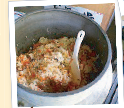
かまどご飯を食べる